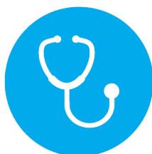
Medicare Part B Doctor and Outpatient