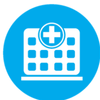
Medicare Parte A Atención de Hospital

Presentación en Persona: Lunes, 10 de Marzo a las 10:30am Marina Senior Center 211 Hillcrest Avenue, Marina, CA 93933