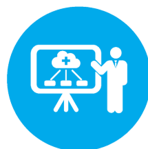
Medicare Part C Medicare Advantage